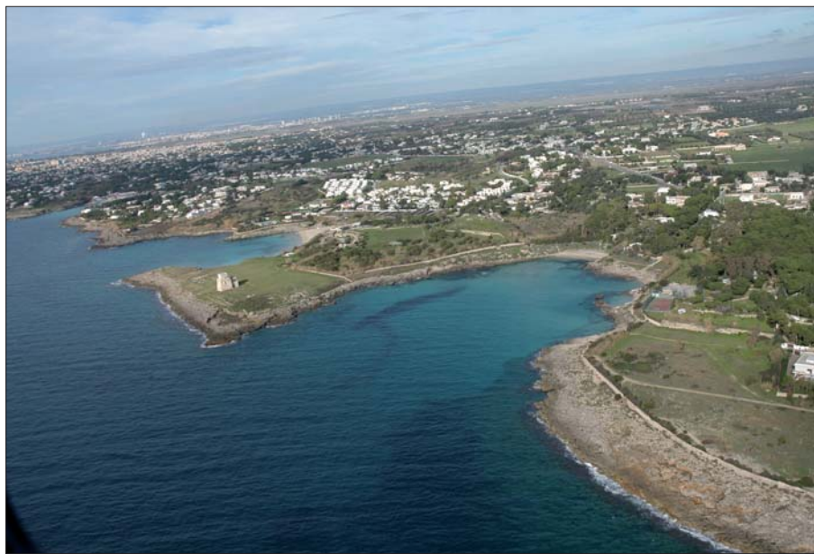
Figura 1 - Veduta aerea del promontorio di Saturo

posta a nord, orientata NNO-SSE, a 25 m. s.l.m., lunga 50 m. e larga 25 m., che separa le due insenature. La posizione topografica in rapporto al territorio agricolo, la naturale conformazione delle insenature e la presenza di