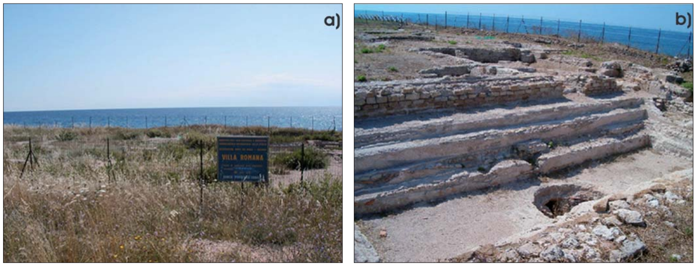
Figura 12 - Vista della natatio pubblica della villa romana prima (a) e dopo (b) gli interventi di recupero e valorizzazione del 2006.