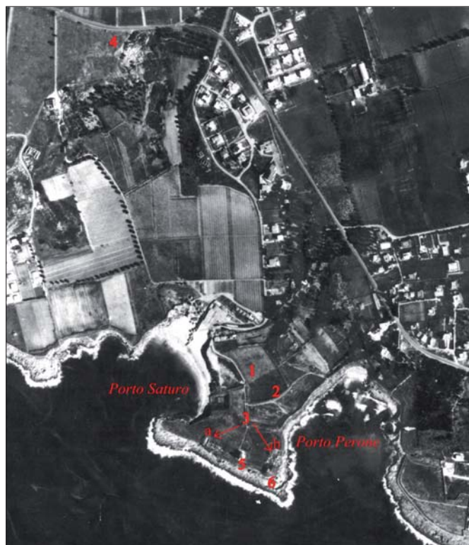
Figura 4 – Indicazione delle aree presenti all'interno del Parco Archeologico. (foto di Sara Nistri, 1978)

Le tracce archeologiche rinvenute danno la prova dell'esistenza, nella zona tra Porto Perone e Porto Saturo, di un santuario; il rinvenimento che ha indotto gli studiosi ad avvalorare tale ipotesi è una stipe votiva