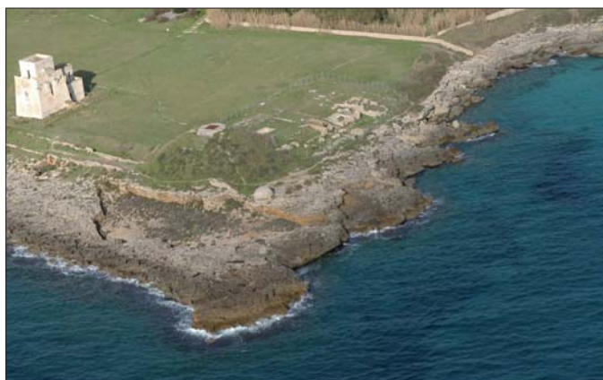
Figura 10 - Veduta panoramica dell'area delle cave antiche

Infine, di non poca rilevanza, è la presenza di un'area di cave antiche nella parte SE del promontorio (figg. 10 e 11), al di sotto del bunker militare, utilizzate anche per la costruzione della torre costiera.