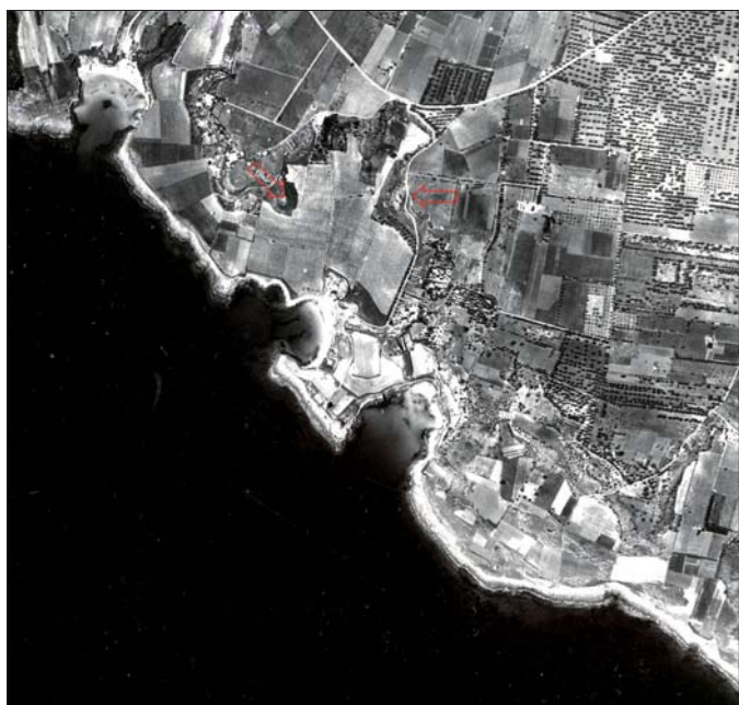
Figura 2 - La laguna costiera oggi interrata: frecce rosse

visibili in alcuni tagli effettuati per l'urbanizzazione, molto spesso abusiva, che sta invadendo e distruggendo i depositi archeologici e la costa. La stessa è, inoltre, visibile sulle carte geologiche (Martinis, Robba, 1971) e