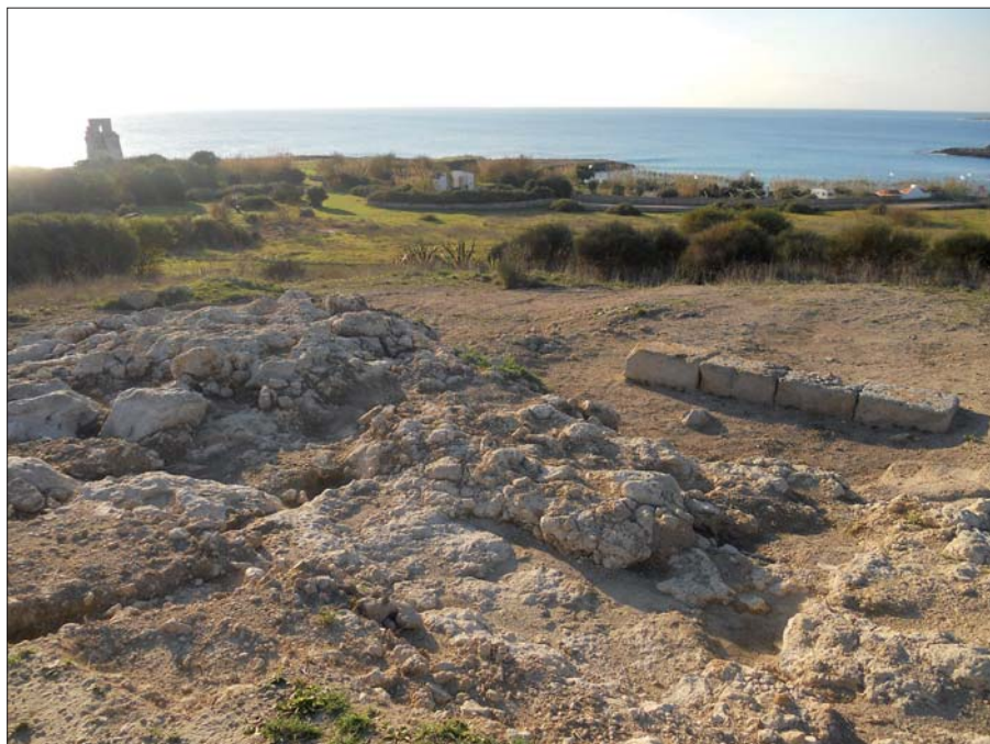
Figura 6 - Resti di strutture del sacello arcaico

costituita di una fossa, profonda m. 0,50 e lunga m 2,50, che si adagiava con il lato est alle fondazioni di un tratto di muro della lunghezza di circa 4 m., con una sola assise di quattro blocchi squadrate di carparo. Alla luce dei dati di scavo, il Lo Porto dichiarò che probabilmente, intorno alla metà del IV sec. a.C., sia stata eretta una struttura in opera quadrata, un temenos o forse un sacello, nell'area di un più antico oikos costruito in materiale deperibile (fig. 6).