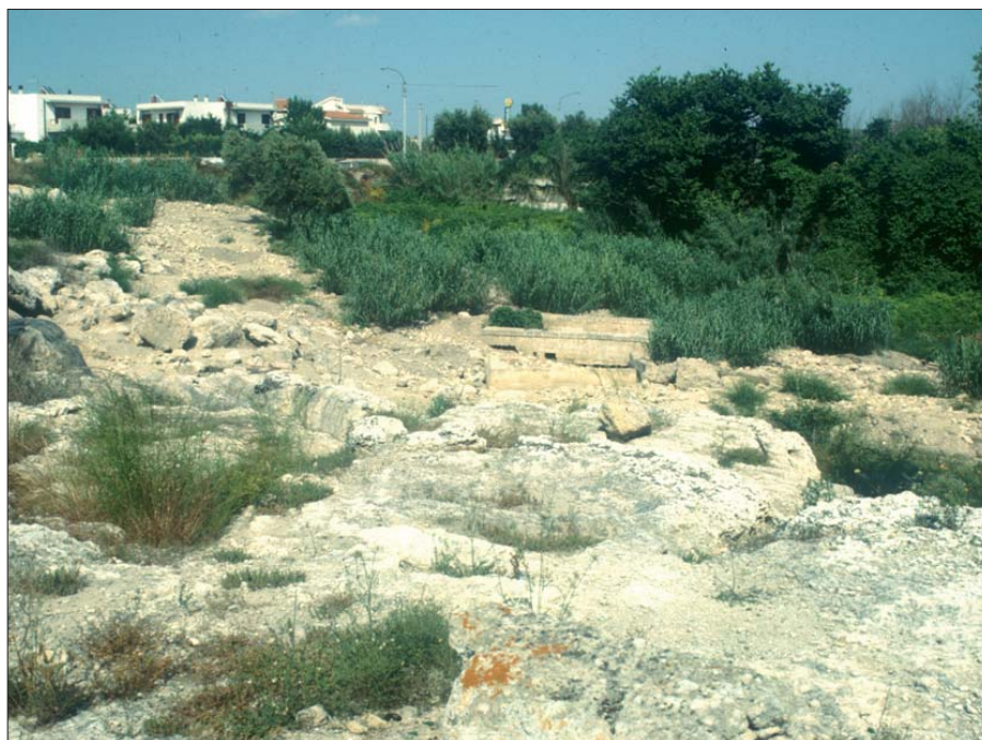
Figura 9 - Area del Santuario della Sorgente (foto di P. Guastella, 1994)

Le altre strutture di questa zona, invece, non si riuscì ad inquadrarle cronologicamente; alcune di esse probabilmente contenevano le stipi di VI e V sec. a.C. Contro il costone roccioso appare di eccezionale interesse il rinvenimento di un'arca litica che custodiva un thesauròs (deposito di oggetti sacri), trovato intatto e contenente ancora diverse centinaia di monete e alcuni oggetti preziosi in oro (anelli, orecchini, aghi). Un altro thesauròs , forse depredata dai continui interventi da parte dei tombaroli, era collocato all'interno del sacello, al centro dello stesso. La densità dei reperti, rese impossibile distinguere i vari contesti votivi, di conseguenza in questo sito i rinvenimenti archeologici furono considerati pertinenti ad un unico contesto. I reperti votivi attestano un'intensa frequentazione, almeno dalla seconda metà del VII sec. a.C., con una ristrutturazione dell'area avvenuta forse intorno alla metà del IV sec. a.C., epoca alla quale potrebbe risalire il sacello. Non è esclu-