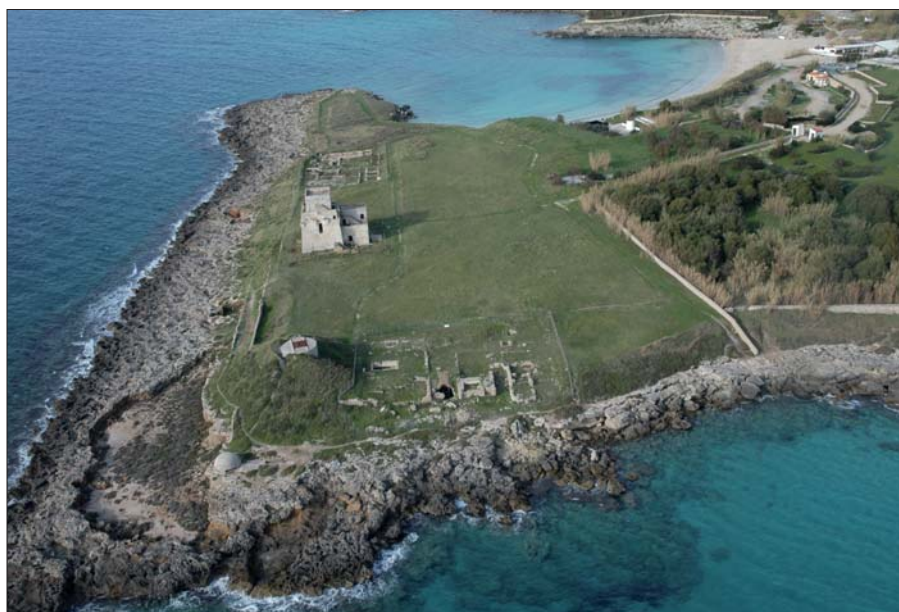
Figura 7 - Veduta aerea della villa romana (foto di M. Guaitoli, 2009)