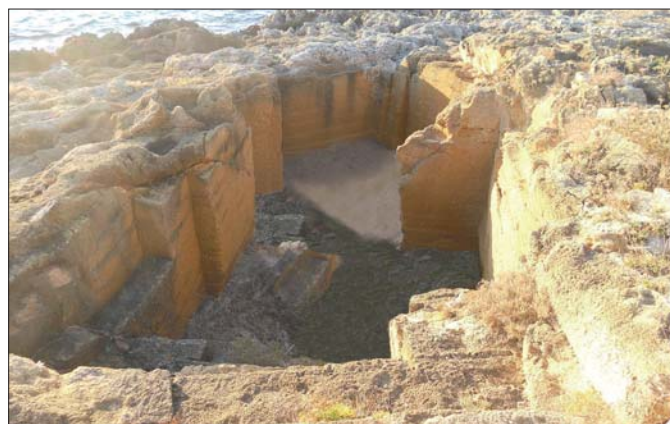
Figura 11 - Particolare dell'area delle cave antiche