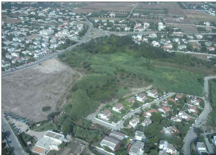
Figura 8 - Veduta aerea del Santuario della sorgente.

Si trova circa 900 m. a nord del promontorio di Saturo, tra l'attuale strada litoranea ed il mare, all'interno di una piccola valle dove scorreva un ruscello che aveva origine da una sorgente di acqua dolce (fig. 8).