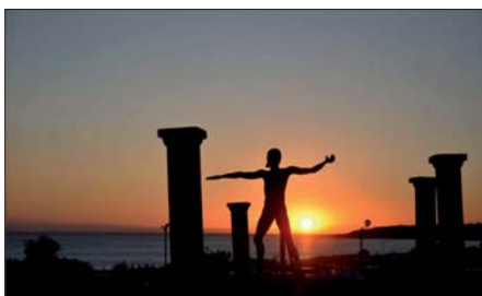
Figura 13 - Vista al tramonto di una statua di Zeus all'interno dell'Arkeogiochi di Saturo.